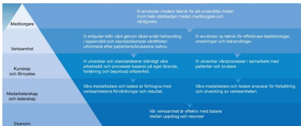
Figur 3. Strategisk karta för Länssjukvården. Bild från Barnsjukvård Verksamhetsplan 2019-2021, s.2

I verksamhetsområdet Barnsjukvårds verksamhetsplan 2019-2021 står att Länssjukvårdens verksamhetsidé och strategi har sin utgångspunkt i Regionens vision och målformuleringar kopplat till de fem perspektiven. Länssjukvården har en strategisk karta kring hur målen i respektive perspektiv samverkar med varandra och utgör därför en grund att nå visionen.