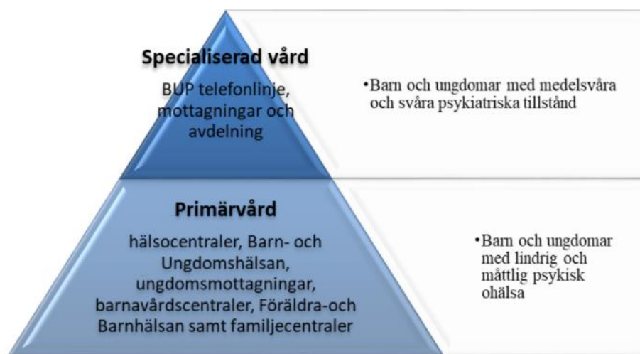
Figur 1. Organisation inom Region Norrbotten. Bild från Ansvarsfördelning mellan primärvård och barn- och ungdomspsykiatri gällande barns och ungdomars psykiska ohälsa, s.2

Av överenskommelsen framgår att primärvården är första linjens hälso- och sjukvård för sådant som inte kräver sjukhusets medicinska eller tekniska resurser eller specialistkompetens. Första linjen för barn och unga med psykisk ohälsa är nivån innan barn- och ungdomspsykiatri och består av verksamheter och funktioner som tar emot barn och unga som visar tidiga tecken på att må psykiskt dåligt. Nedan finns en figur som förklarar den specialiserade vårdens ansvar och primärvårdens ansvar.