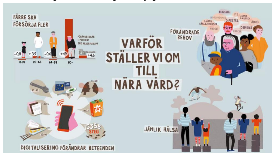
ILLUSTRATION SVERIGES KOMMUNER OCH REGIONER

Vi kan inte fortsätta att arbeta som vi alltid har gjort. För att möta förändrade behov och förväntningar i befolkning behöver hälso- och sjukvårdssystemet ställas om. Vägen till förändring blir möjlig först när vi förstår våra varför.